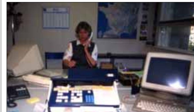
Un travail qui demande une grande disponibilité professionnelle et un esprit en veille permanente