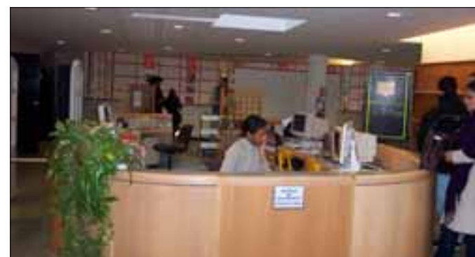
Accompagner les étudiants dans leur parcours universitaire : accueillir, renseigner mais aussi informer, conseiller, orienter...

Le PCRD est un programme d'aide à la recherche qui m'amène à recueillir et diffuser l'information sur les appels à propositions et à aider les chercheurs au montage financier et administratif des propositions.